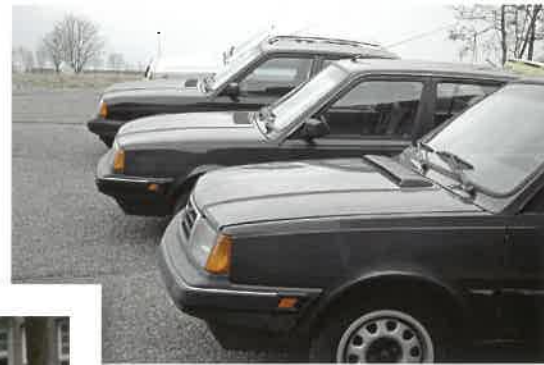
► Vier 300er Schnauzen

PS) oder einem B200E-Motor (111 PS) mit Einspritzsystem und einem 1,7-Liter-Motor mit 80 PS (B172K) ausgestattet. Dieser Motor stammt wieder von Renault. Volvo 340: Einbau neuer Motorlager, neue Abgasanlage, neues Geräusch-Isolierungspaket, neuen Luftzug und neue Dichtleisten. Dies reduziert die Innengeräusche auf maximal 73 dBA bei 120 km/h und 76 dBA bei 140 km/h. Schiebeverankerungen für die vorderen Sicherheitsgurte parallel zu den Einstiegsleisten. Beleuchtung: Hauptscheinwerfer schalten sich automatisch aus,